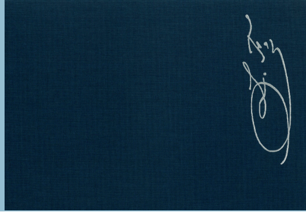
Einband der Ganzleinenbände Cover of the clothbound volumes

This edition was made possible in part through a grant from the Deutsche Forschungsgemeinschaft (German Research Society)