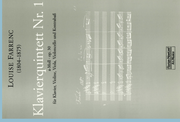
Forum Neozel Am Music